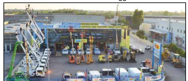
La nuova sede della Noleggio Lorini in zona industriale, via E. Montale 15.

SEDE: MONTICHIARI (BS) - Via E. Montale, 15 FILIALI: CALCINATO - CASTEGNATO tel. 030.9650556 - www.noleggiolorini.com