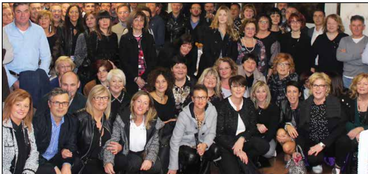
Un primo piano delle coetanee presenti alla festa.