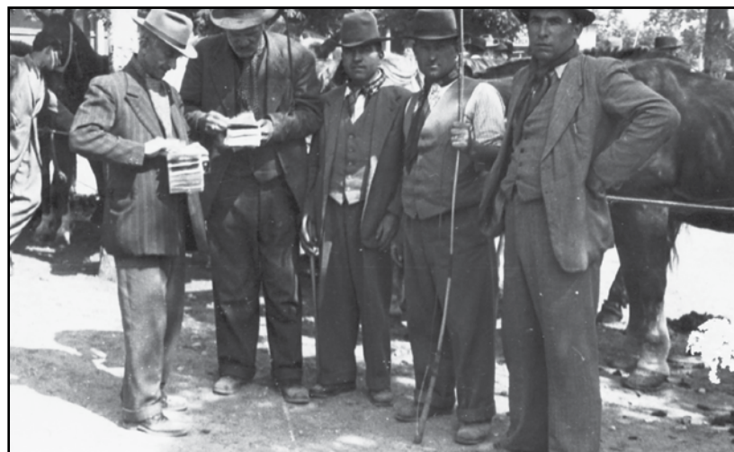
I bei tempi dove si facevano affari.

Altra osservazione delle minoranze riguarda l'affermazione, più volte ribadita, che il Centro Fiera si sarebbe retto con